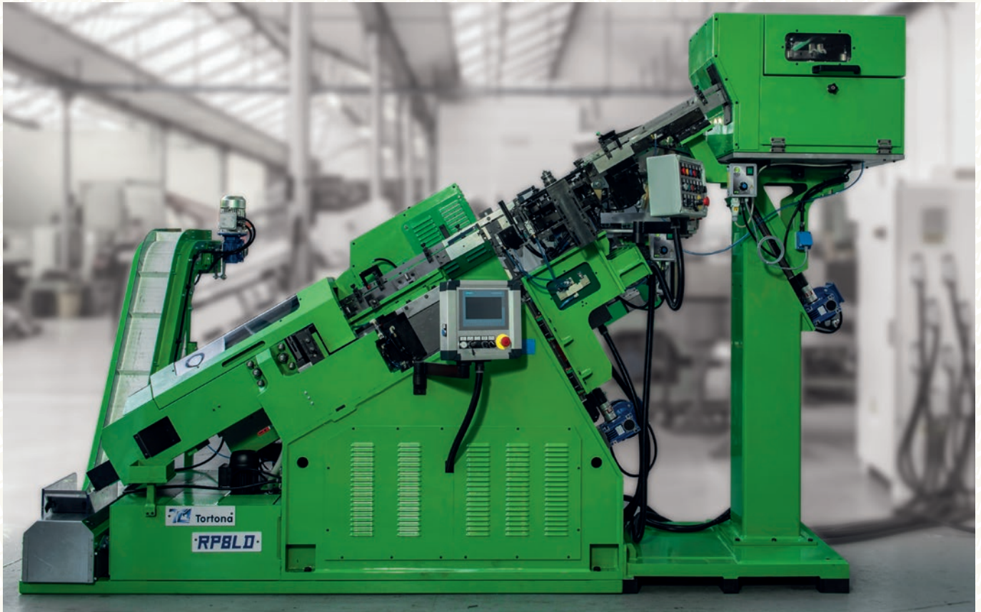
RP8LD mit kufenschlitten in kombination mit buchsen-sonderladegervorrichtung. Laden und rollen von buchsen bis zu 16 mm durchmesser.